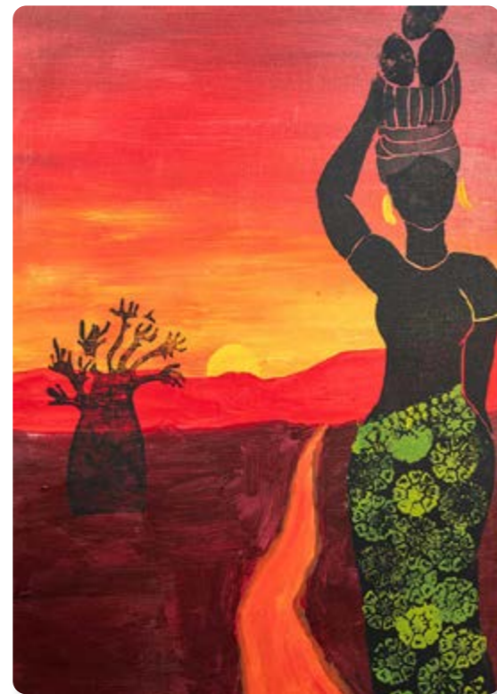
Det farverige og inspirerende motiv: En rejse til mit barndomsland er malet af Regine Sølvsten Nissen, der på daværende tidspunkt gik i 9. klasse

1 stk. 15 kr, 4 stk. 50 kr. Noreashop.dk